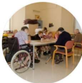
CENTRE DE DIA